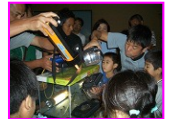
虫の観察(虫の音鑑賞会)