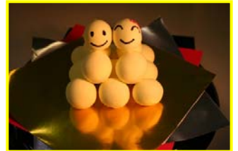
お月見団子(イメージ)