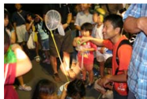
虫の観察(虫の音鑑賞会)