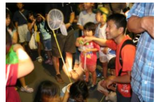
虫の観察(虫の音鑑賞会)