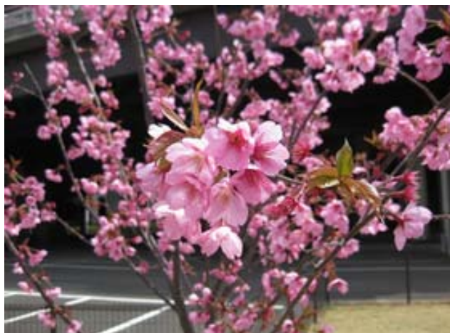
( 3月末、地震にも負けず見事に咲いた横浜ハマ緋サクラ )