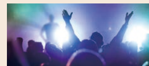
アーティストのライブ会場