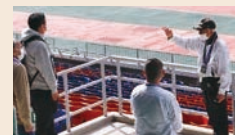
ツアーボランティア