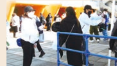
運営ボランティア

Yokohama Final Stadium × 3 STADIUM TOURS 2002 FIFAワールドカップ™・ラグビーワ ールドカップ2019™・東京2020オリンピ ック競技大会の決勝の地で、選手になっ た気分を体感できます。