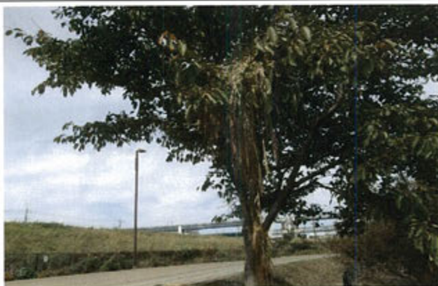
流された稲束は、あちらこちらの木の上にも引っかかっていました。