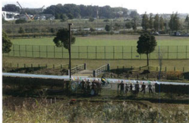
左の写真と右の写真を見比べてください。越流前はフェンスに案山子が並んで、日差しの中、のどかな風景です。