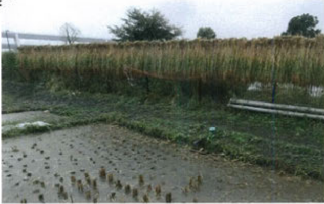
5日午後刈りが終わった稲束は、田圃脇のフェンスいっばいに掛けられ、多少の降雨の心配も免れたと思われました。

10月5日から6日にかけて豪雨を降らした台風18号は、新横浜公園に過去15回越流のうち最大量を貯留しました。総貯水量は約390万m 3 とされていますが、京浜河川事務所の計量では総貯水量の約40%の154万m 3 とのことでした。5日朝から降りだした雨の中での稲刈り作業もなんとか終了し、フェンスに掛けられた稲束(写真)は、5日晚から6日朝にかけて降り続いた豪雨で全て流されてしまいました。(佐藤大治)