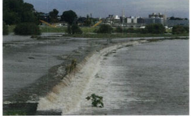
6日朝の越流状況です。画面左側が鶴見川です。川が増水するとこの部分から越流するような仕組みになっています。