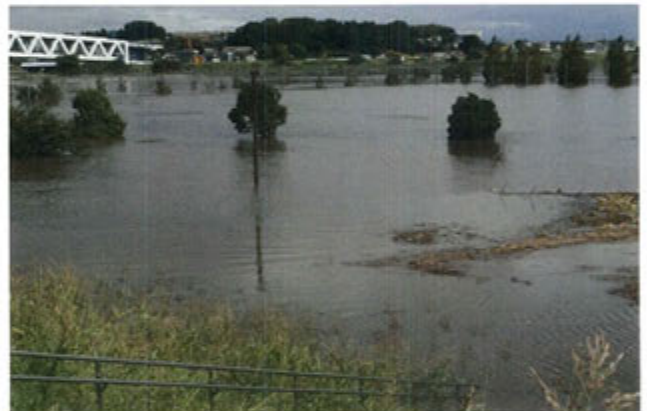
6日朝の風景です。案山子もフェンスも水没して稲束もすべてが流されてしまいました。中央の木2本は頭だけが出ています。