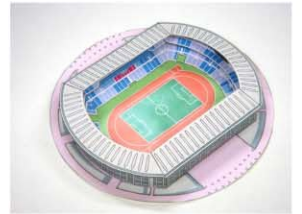
■ 出来上がり ※実物とは色彩・形などが多少異なります。

② 観客席(D)2枚を輪の状態にして付け、二階席(E)を両側に貼ります。それを土台(A)に貼ります。 ③ 最後に屋根(F)を両側に付けます。