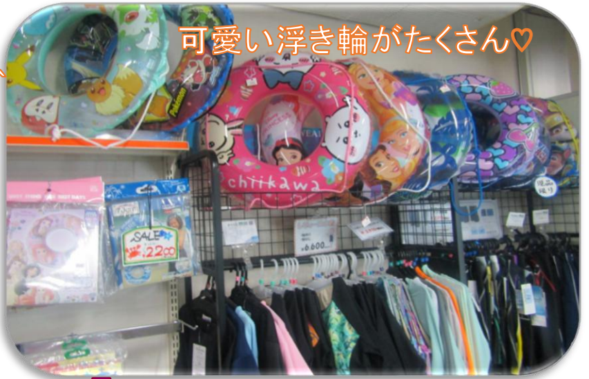
可愛い浮き輪がたくさん♡