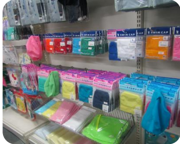
タオルやスイムキャップもたくさん♪