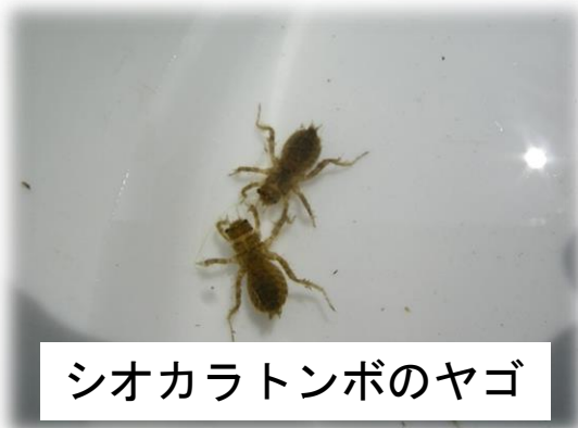
シオカラトンボのヤゴ