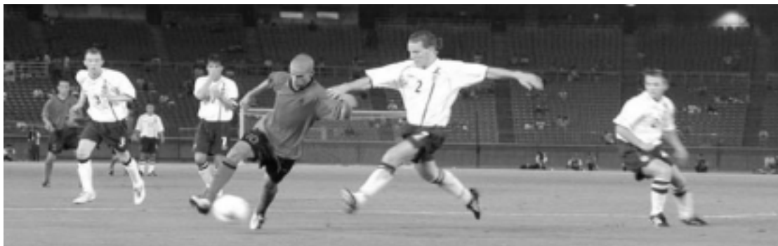
決勝戦： イングランド VS オランダ