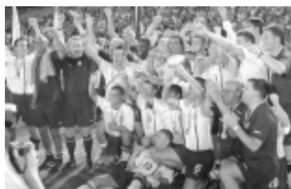
INAS-FID 優勝に歓喜するイングランド代表選手

W杯をきっかけに、障害のある人びとの間でもサッカーは広がりを見せているようで、メディアも目を向けている。NHKで「シュートはワールドカップばかりじゃない」と題して9月21日に90分のテレビ特集を組み、ろうの女性のフットサル・チームなども紹介された。