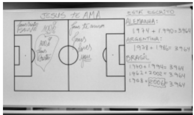
勝利の方程式(ブラジル代表チームのホワイト・ボード)