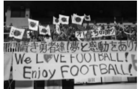
W杯と変わらぬ声援が日本代表に送られた